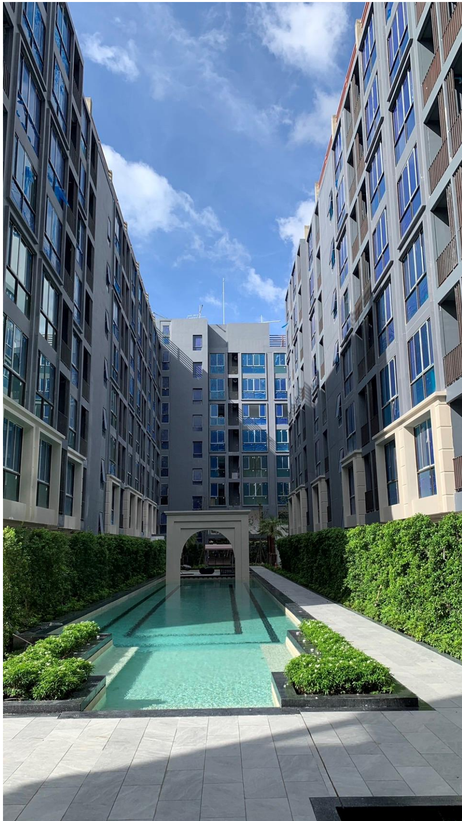
รูปที่ 1.3 สภาพโครงการในปัจจุบัน